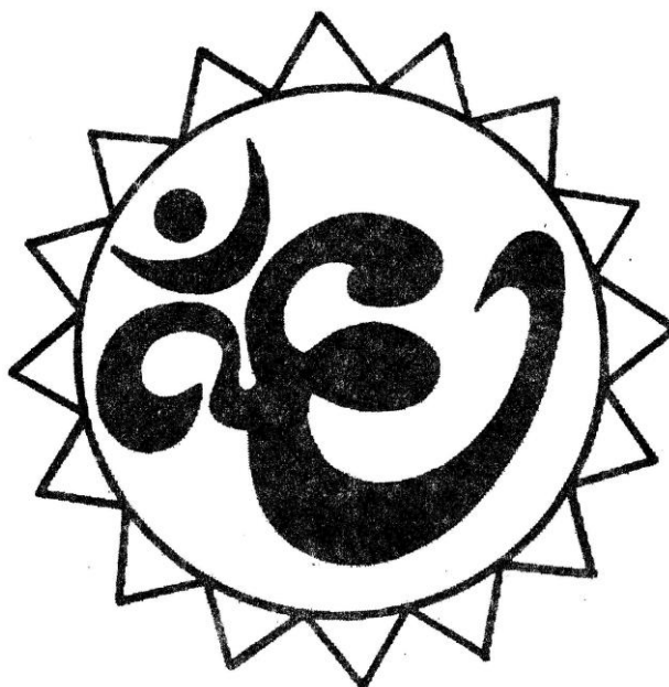
Рисунок для фиксации глаз

Вариант 3. Вокруг знака проведена окружность. Перемещайте свой взгляд по окружности, двигая одновременно глаза и голову. Делайте упражнение вначале с открытыми глазами, затем с закрытыми, представляя окружность.